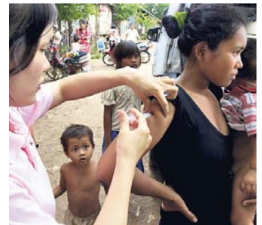
MOBILT HELSETEAM: En kvinne får vaksine mot stivkrampe.