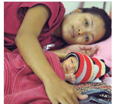
PREMATUR: Dette barnet hadde hatt liten sjanse til å overleve en start i slummen.